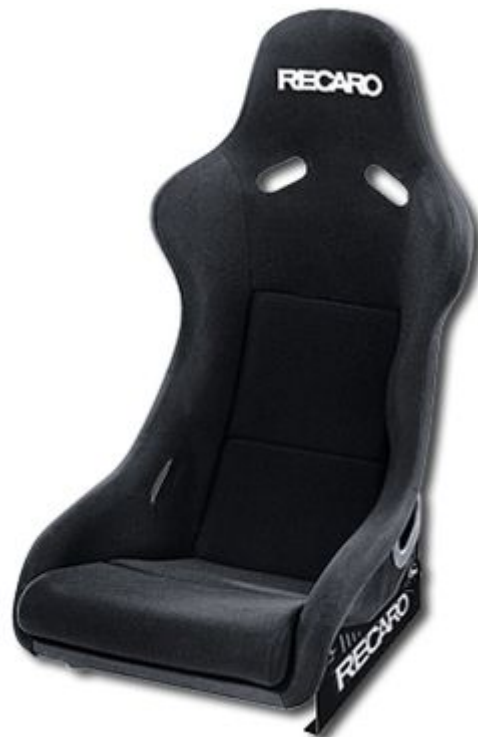
RECARO Pole Position N.G. (FIA)