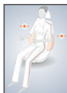
Réglage des joues latérales du dossier Animation