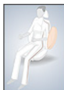
Airbag latéral universel Animation