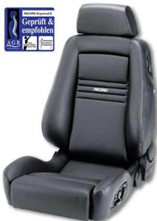
RECARO Ergomed ES